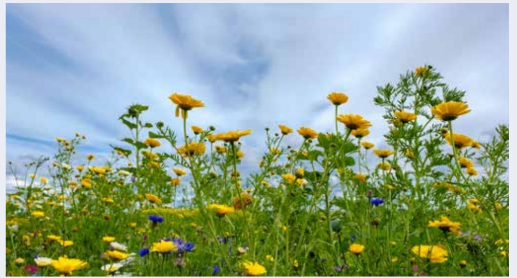
Een van de ideeën op de website Stem van Ten Boer: een pluktuin in Sint Annen.