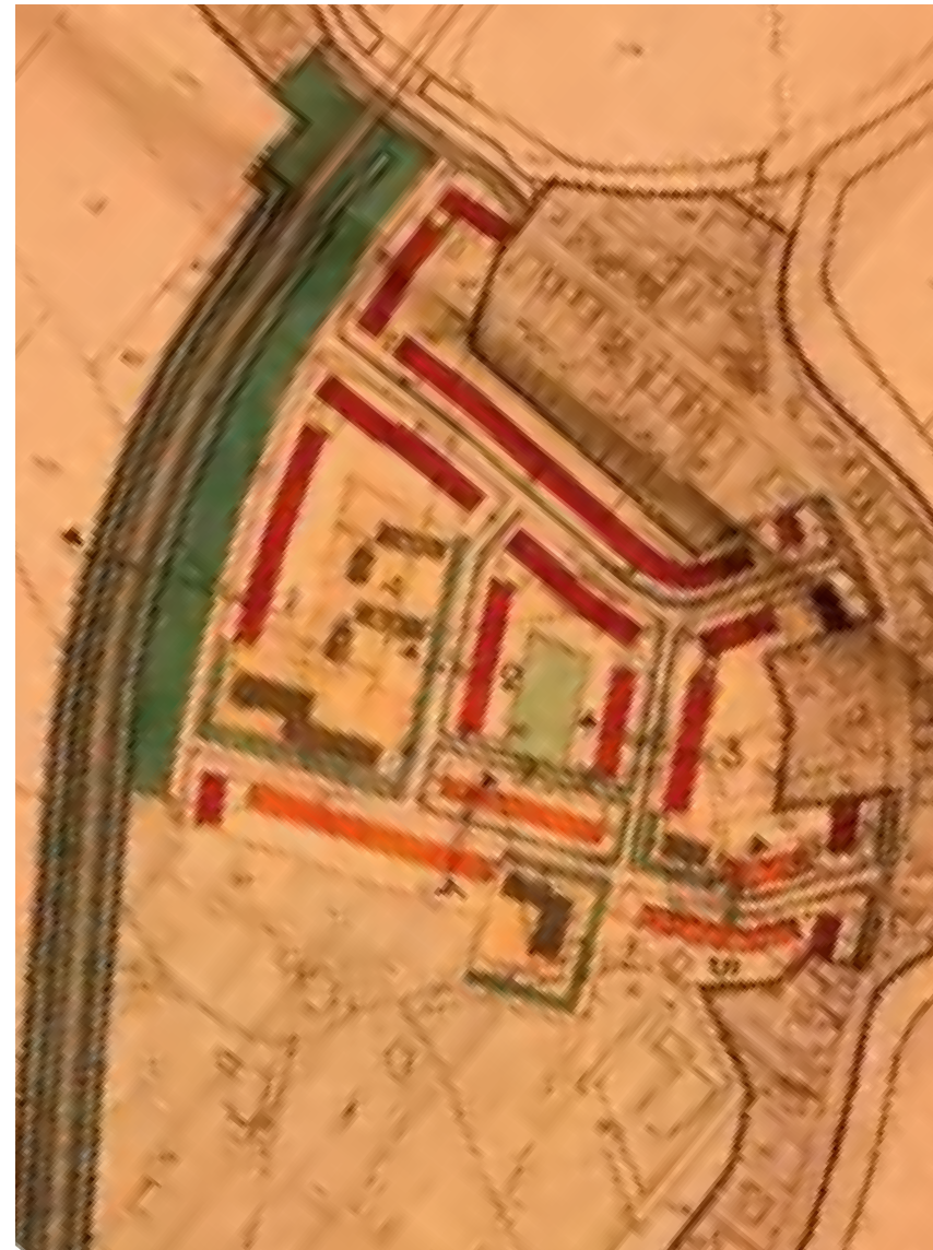
Uitbreidingsplan Ten Post

In de historische kaartenreeks zijn eerst de woningen aan de Johan Rengersstraat te zien, die later in het zuiden worden uitgebreid. De Jan Zijlstraat is de laatste straat die is aangelegd en pas zichtbaar is op de kaart van 1982. De woningen dateren overwegend uit de jaren zeventig. Belangrijk karakteristiek voor de Nijebuurt is de planmatige strokenverkaveling met groene ruimtes. Die bevinden zich in de Tammingastraat, bij de scholen en kerk, op achterterreinen en langs de rand. De bebouwing is overal vergelijkbaar in korrel en voorzien van kap, met de bijzondere gebouwen (kerk, scholen) en woningen in het groen, als bewuste uitzondering. De recente woningen aan de Tammingastraat zijn een niet bewuste uitzondering op deze regel.