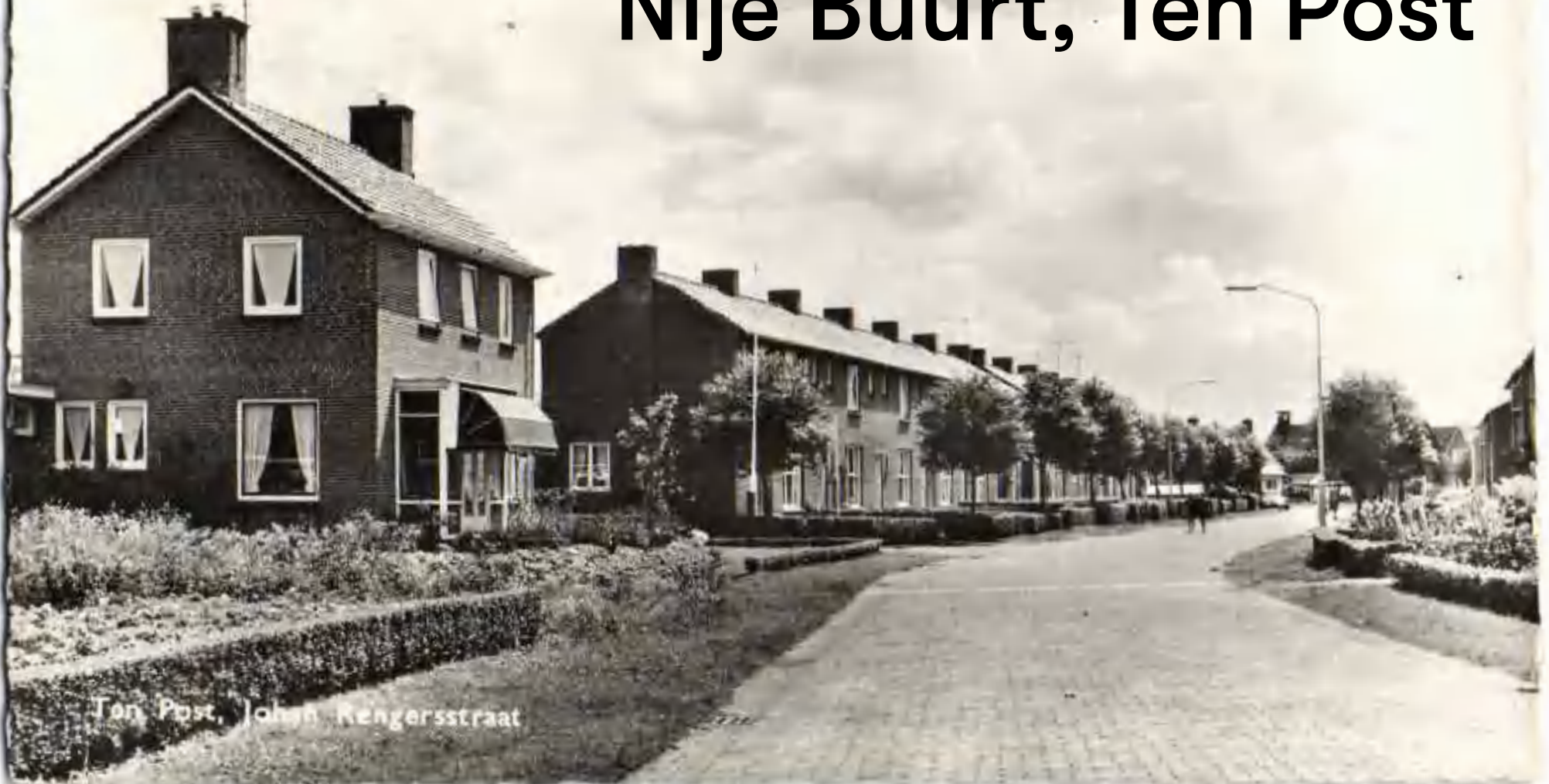
Ten Post, Johan Rengersstraat