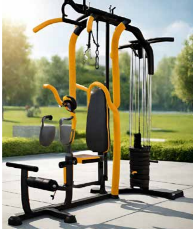
Voorbeeld van een beweegtoestel

Wilt u weten welke regelingen en subsidies er voor u van toepassing zijn? Log dan in met uw eigen DigiD op de website van SNN: https://eloket.snn.nl/eloket/bezoekers/login.jsp .