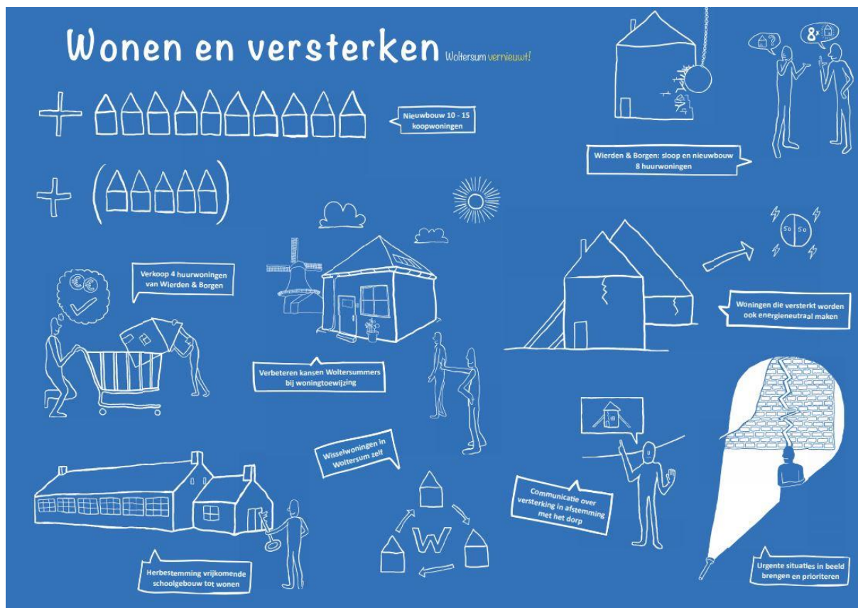
Figuur 2: Deze plaat is gemaakt met de inwoners van Woltersum