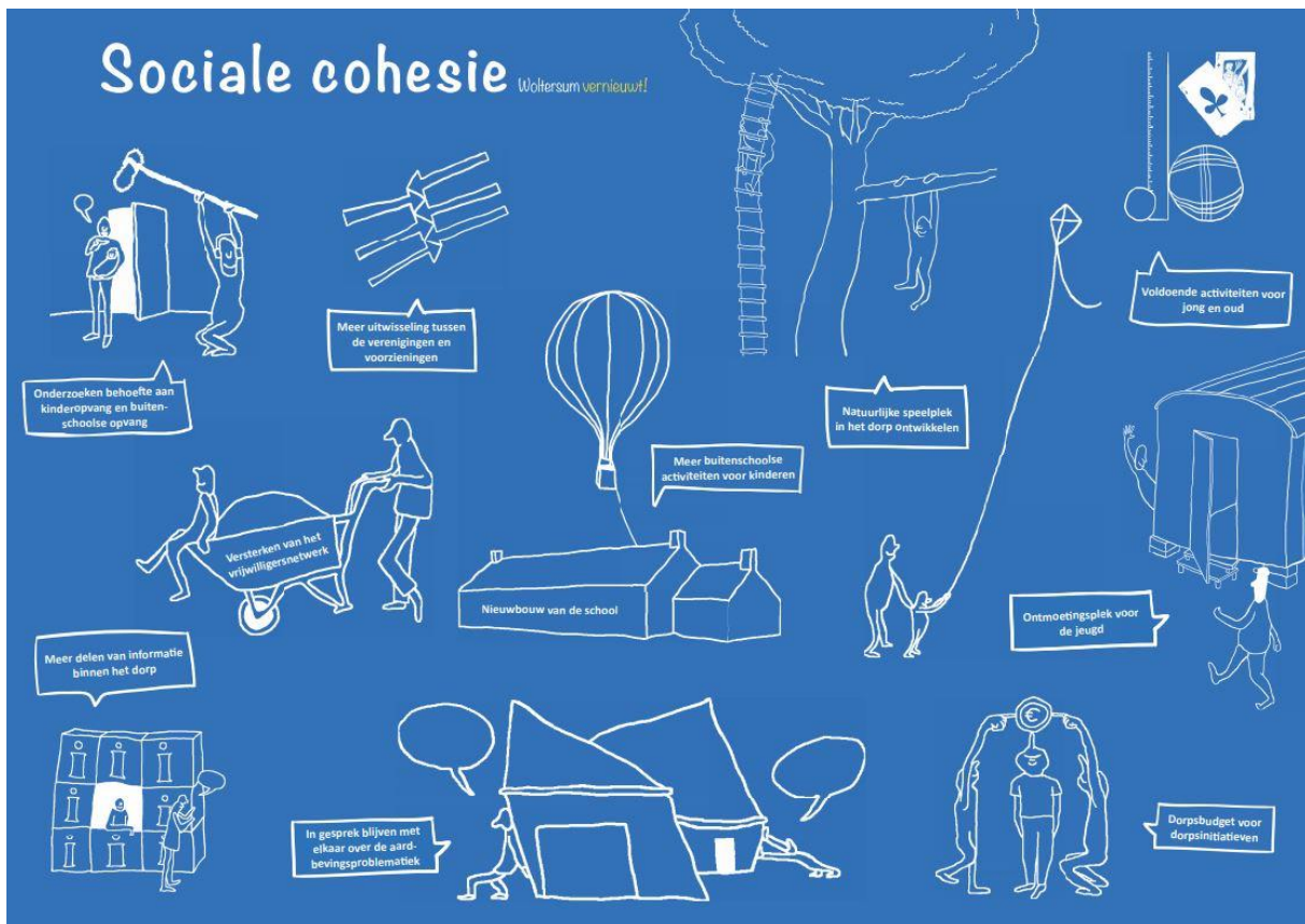
Figuur 1: Deze plaat is gemaakt met de inwoners van Woltersum