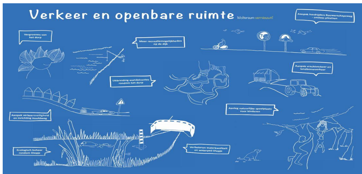
Figuur 3: Deze plaat is gemaakt met de inwoners van Woltersum

Ook willen we toeristisch-recreatief ondernemerschap in het gebied stimuleren, zodat Stadgers vaker het Ommeland intrekken en combinatiebezoek Stad-Ommeland toeneemt. We gaan de samenwerking op het gebied van toerisme tussen ondernemers in stad en regio versterken.