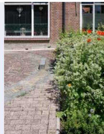
Een versteende en een groene tuin.

Ga op de website gemeentegroningen.nl naar 'subsidie klimaat aanvragen' en vul het formulier in met wat u wilt aanpakken. Een aanvraag is geldig tot een jaar vooruit of een jaar terug. Indienen kan tot 30 juni 2023.