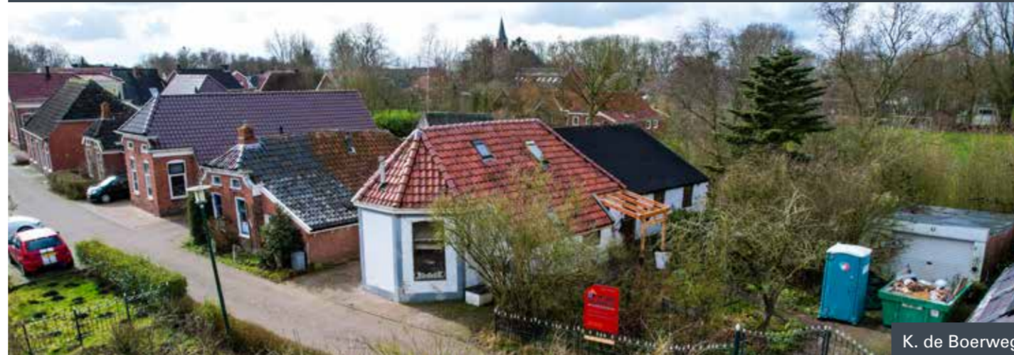
K. de Boerweg