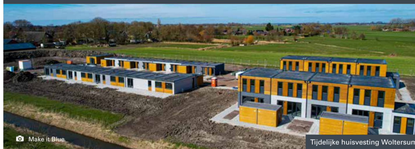
Tijdelijke huisvesting Woltersum