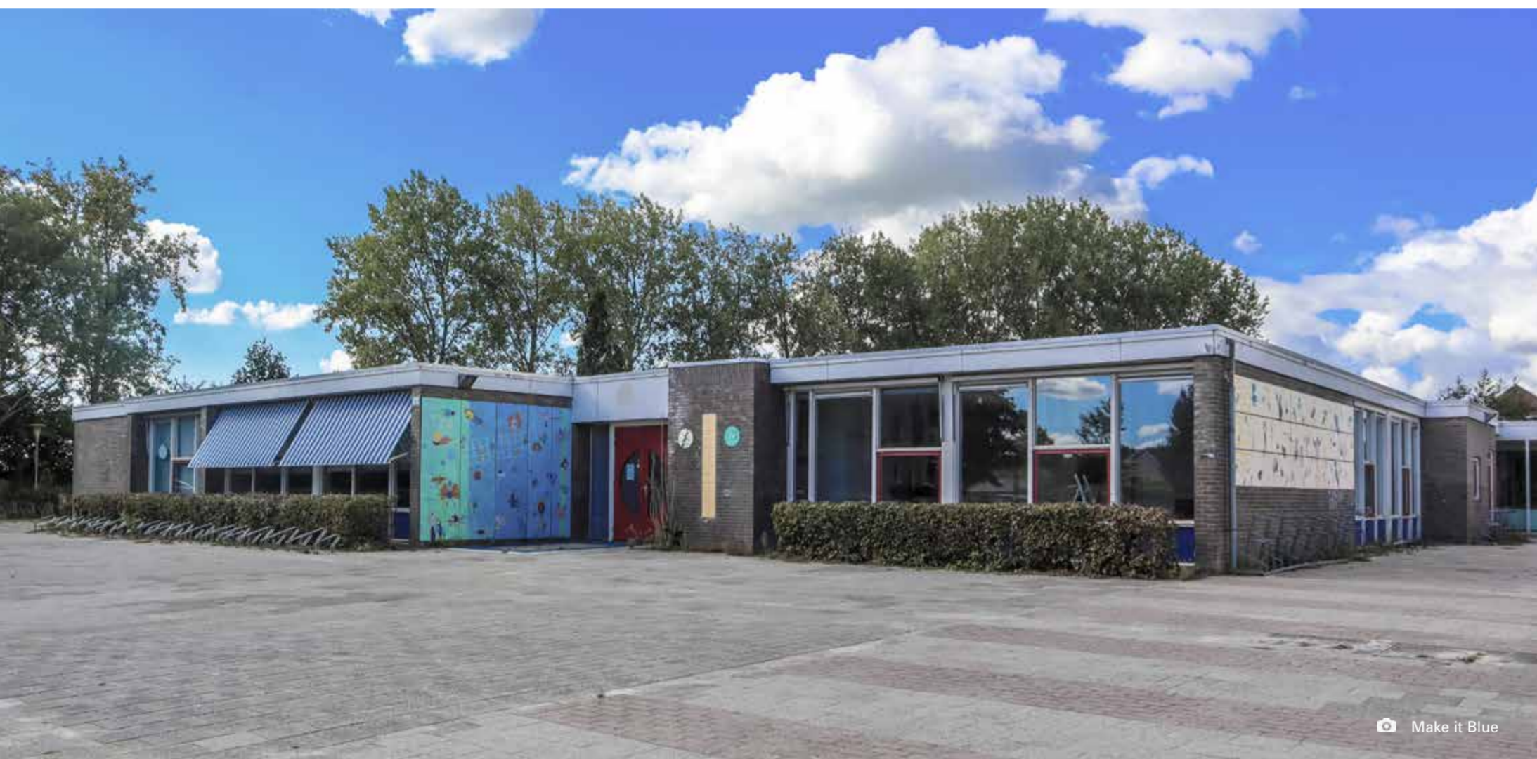
Make it Blue

De herinrichting van de Ommelanderstraat aan de oneven zijde start nadat die woningen ook zijn gesloopt en vervangen door nieuwe aardbevingsbestendige woningen. Daarna wordt de straat zelf opnieuw ingericht.