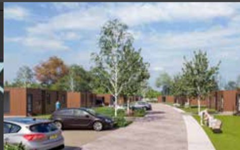
Impressie van nieuwe tijdelijke woningen

Meer informatie: versterkenenvernieuwen.groningen.nl/tijdelijkehuisvesting .