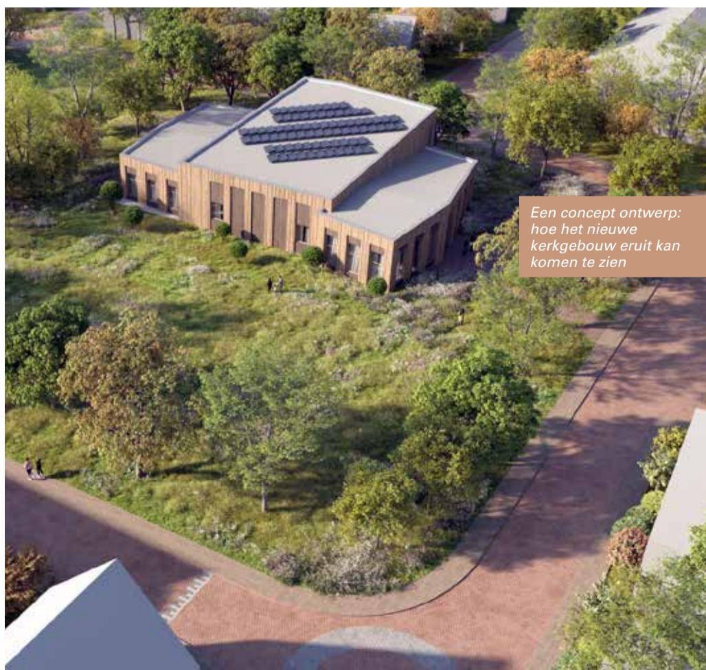
Een concept ontwerp: hoe het nieuwe kerkgebouw eruit kan komen te zien

Koopmansplein 9 in Ten Boer Elke dinsdag van 17.00 tot 19.00 uur