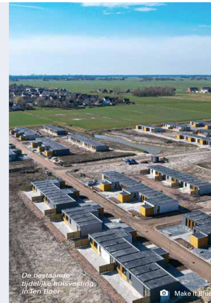
De bestaande tijdelijke huisvesting in Ten Boer

Actuele informatie kunt u vinden op versterkenvernieuwen.groningen.nl/tijdelijkehuisvesting en via de digitale nieuwsbrief.