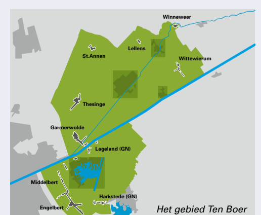
Het gebied Ten Boer

Dit is een informatiekrant van de gemeente Groningen met algemene informatie over de versterkingsopgave en dorpsvernieuwing in het gebied van de voormalige gemeente Ten Boer. Kijk voor actuele informatie op de website van Versterken en Vernieuwen van de gemeente Groningen: https://versterkenenvernieuwen.groningen.nl