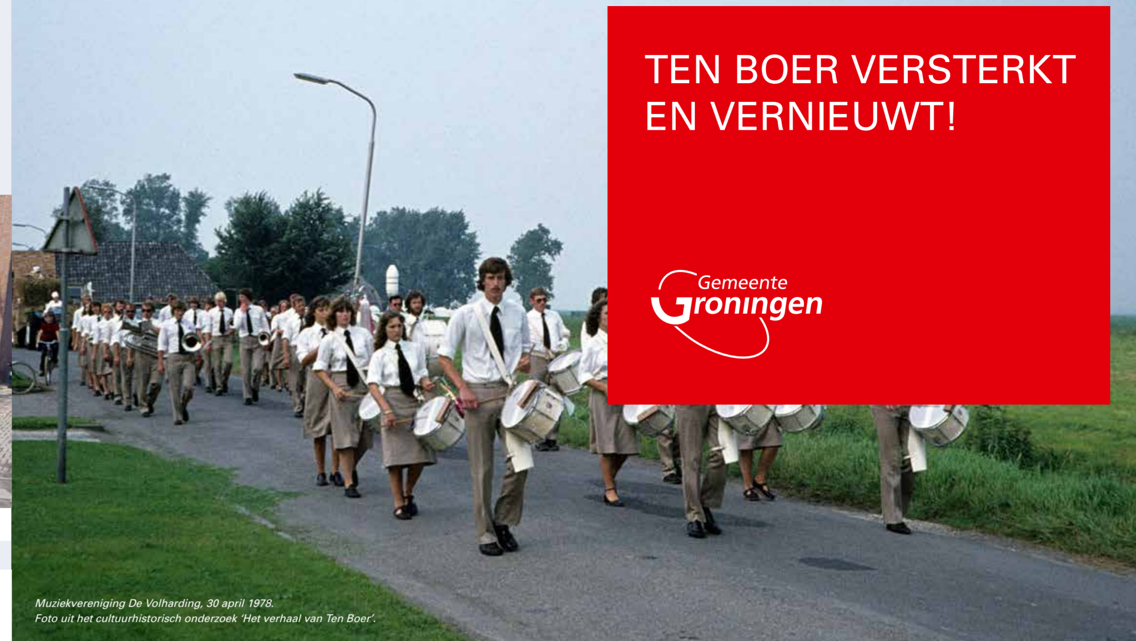
Muziekvereniging De Volharding, 30 april 1978. Foto uit het cultuurhistorisch onderzoek ‘Het verhaal van Ten Boer’.

De kantoren aan de A.H. Homanstraat 23 zijn gesloten op donderdag 5 mei (Bevrijdingsdag), donderdag 26 mei (Hemelvaart) en maandag 6 juni (Tweede Pinksterdag).