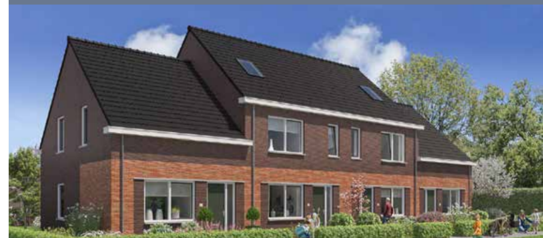
Impressie van Blinkerdlaan en Ommelanderstraat

Half maart leverde Wierden en Borgen tien nieuwe, gasloze en aardbevingsbestendige gezinswoningen aan de Marskramer op. Alle bewoners komen uit de woningen in de Ommelanderstraat en Blinkerdlaan die gesloopt worden. Ze konden dus van dichtbij zien hoe het ging met de bouw. Een aantal bewoners koos ervoor om voorgoed te verhuizen naar een andere woning. De rest gaat weer terug naar hun bekende plek aan de Ommelanderstraat en Blinkerdlaan als hun nieuwe huis klaar is.