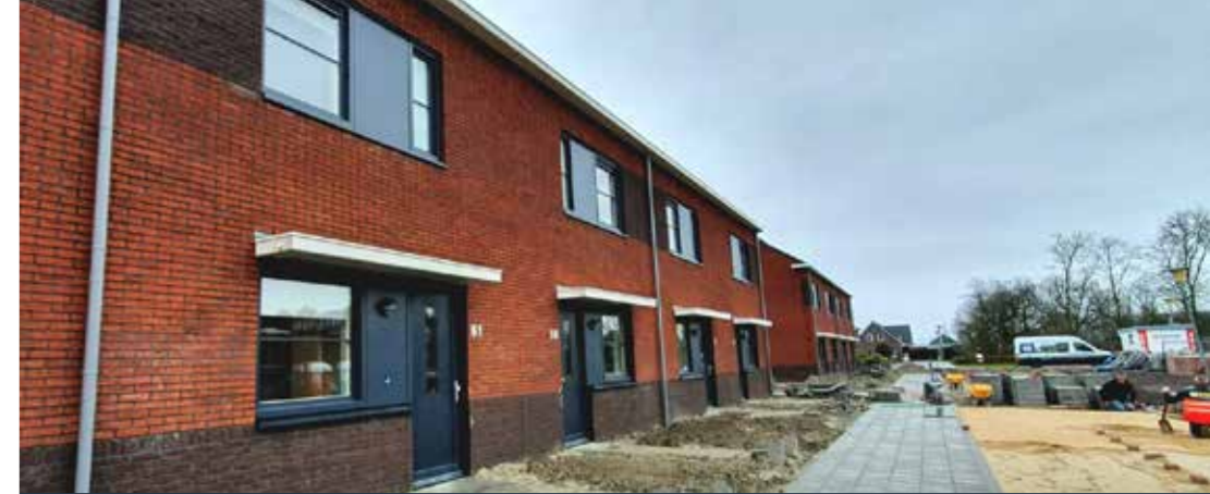
Marskramer, Ten Boer.

Eind maart verhuisden de veertig bewoners van De Lindenhof naar hun tijdelijke woonplek in woonzorgcentrum Innersdijk in Ten Boer. "Dat is vlak bij, maar het blijft een hele operatie. Het ging om mensen op leeftijd die intensieve zorg nodig hebben. Sommige bewoners moesten met een ambulance naar hun nieuwe woonplek."